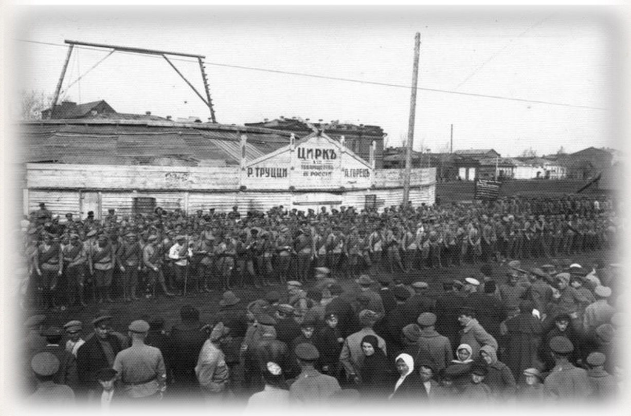
Парад части Красной армии у цирка Труцци. г. Екатеринбург.