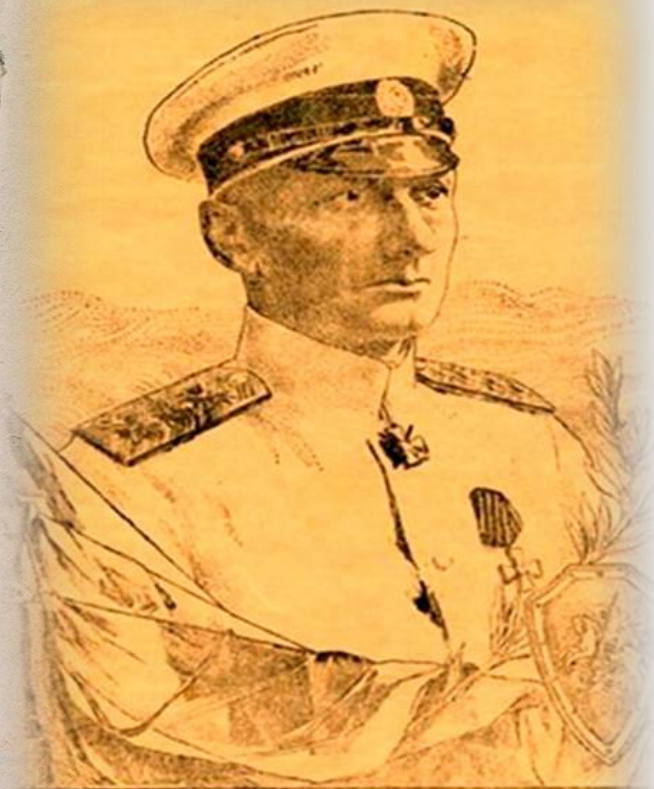
ВЕРХОВНЫЙ ПРАВИТЕЛЬ РОССИИ АДМИРАЛЪ АЛЕКСАНДРЪ ВАСИЛЬЕВИЧЪ КОЛЧАКЪ.