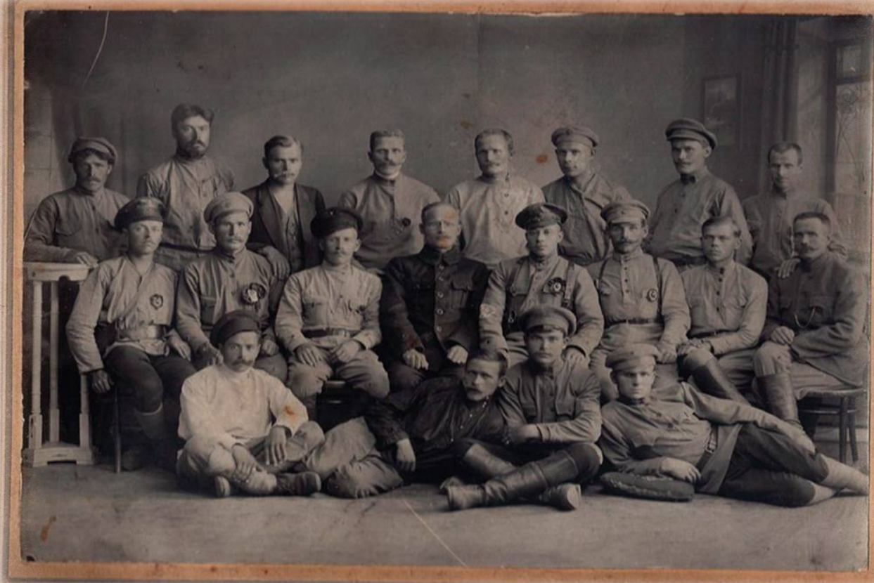
Штаб 1 Камышловского полка. Фотография. 1918 г.