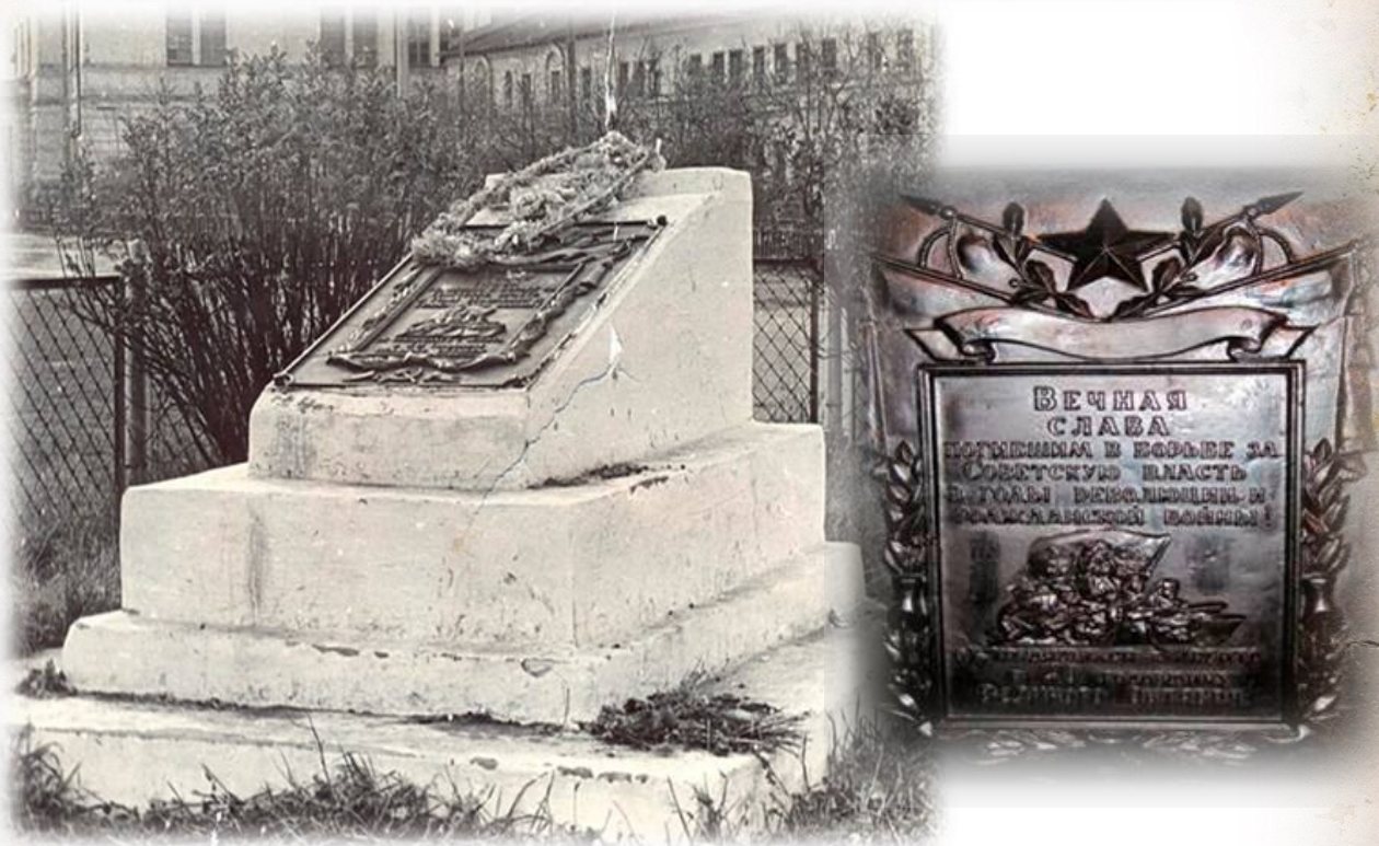
Надгробие на площади В.И. Ленина г. Ирбит. Фотография. Из фондов МКУК МО г. Ирбит «Историко-этнографический музей»