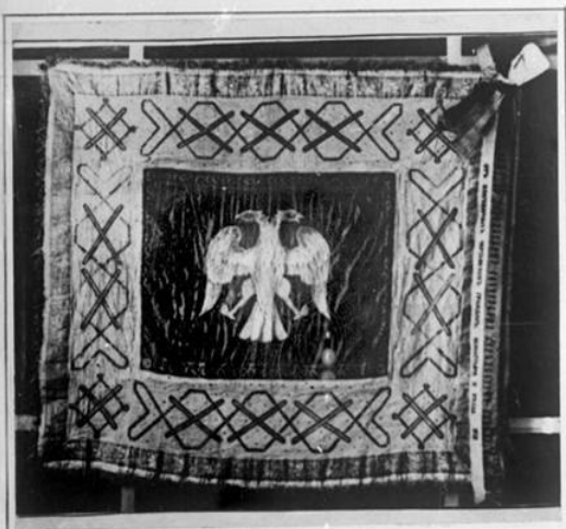
Снимок со знамени, изготовленного монахинями монастыря для белогвардейского полка. Знамя хранится в музее Красной Армии в Москве. Такие знамена изготавливались монахинями из шелковых платьев купчих и своих собственных.