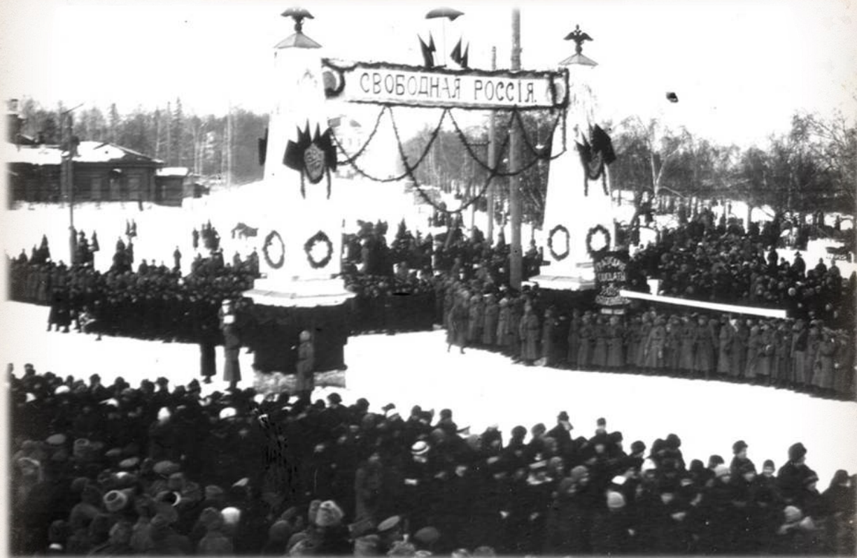
Митинг в честь «Свободной России» у Московской заставы. 1917 г.