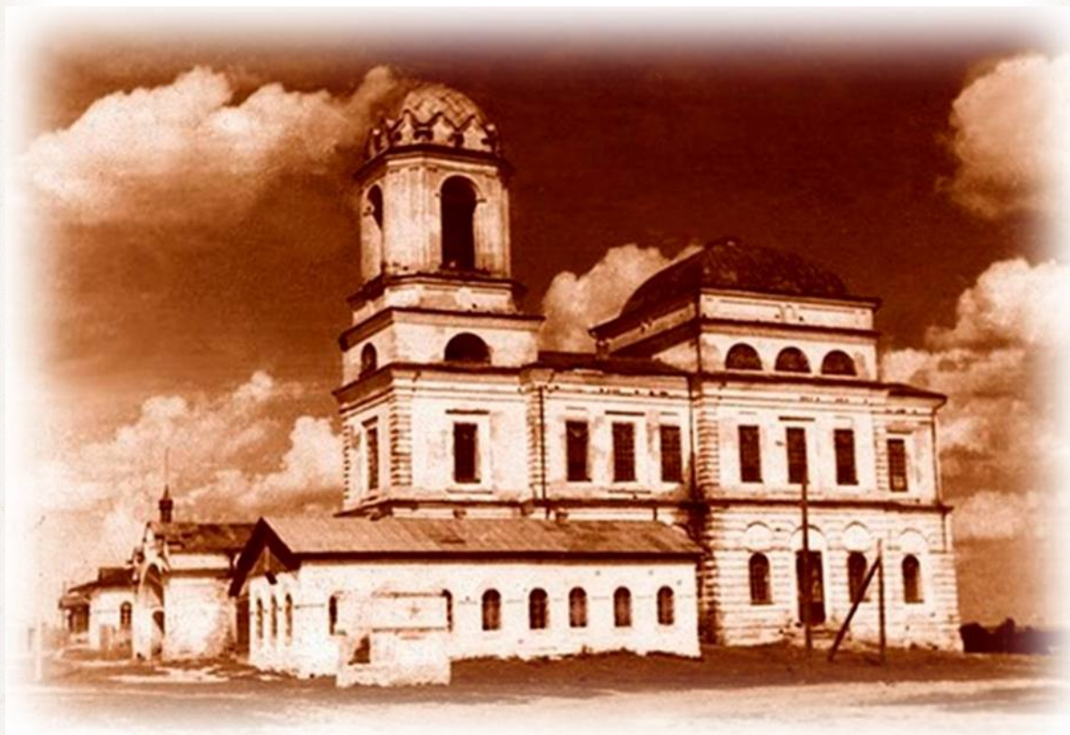
Храм в селе Покровском