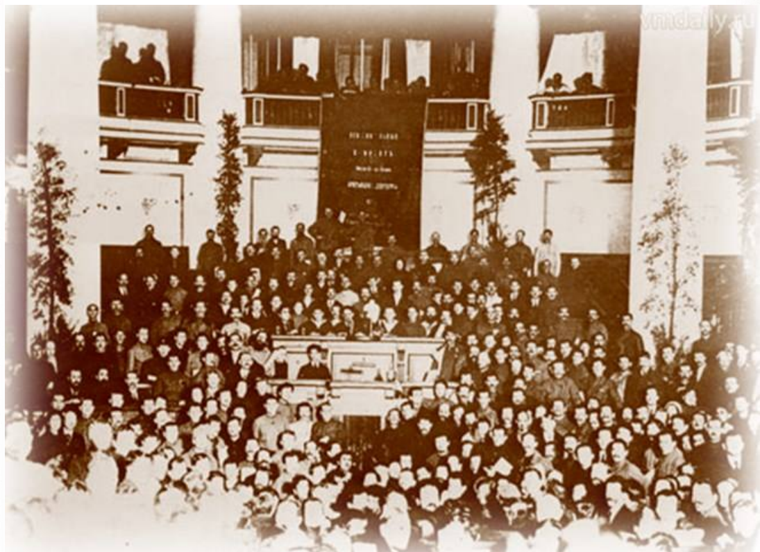
Учредительное собрание. Фото 1918 г.