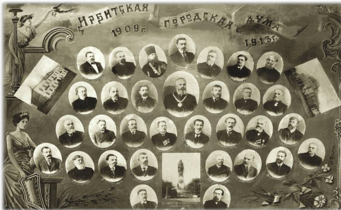
Состав Ирбитской городской думы 1909-1913гг.