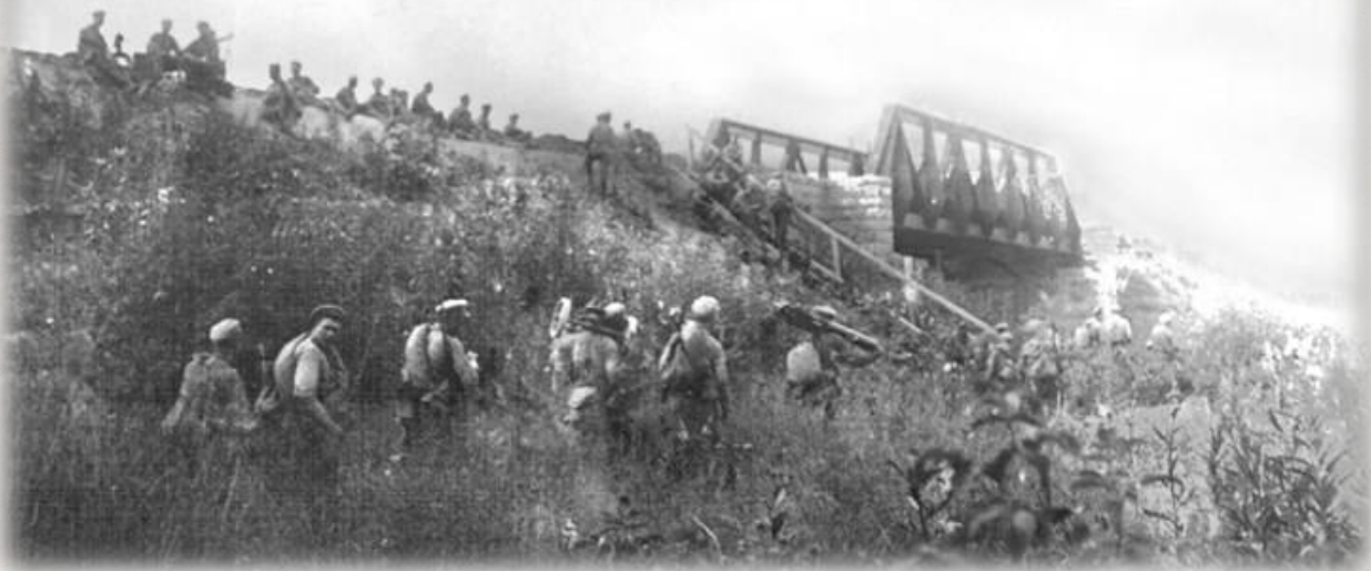
Наступление Красной армии на Екатеринбург в ночь с 14 на 15 июля 1919 г.