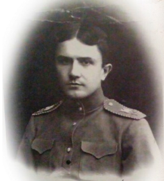
Пахомов В.И. Фотография . Начало XX века Из фондов МКУК МО г. Ирбит «Историко – этнографический музей»