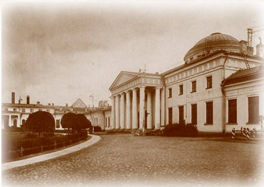
Таврический дворец . Фото 1918 г.