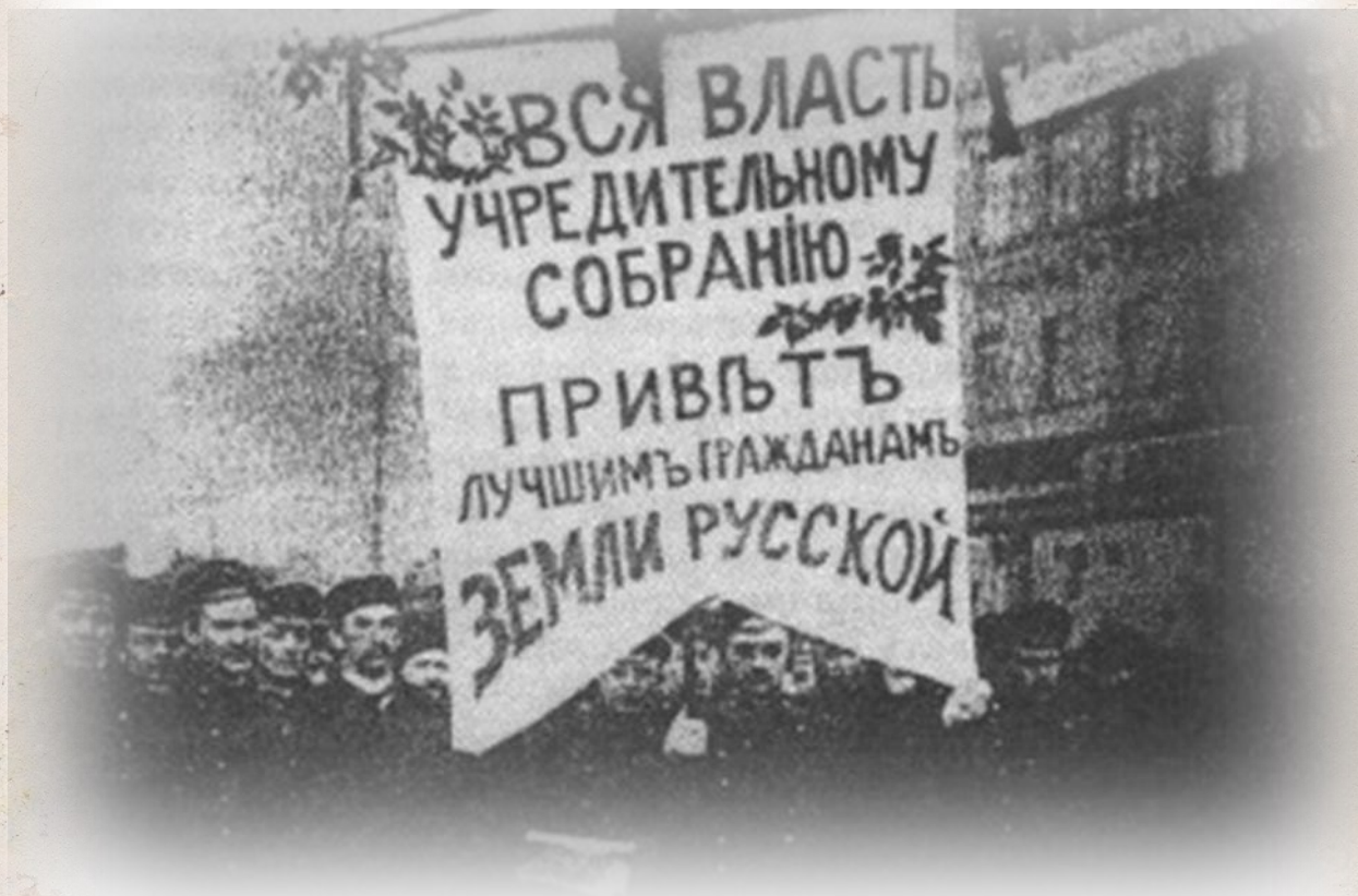
Демонстрация в поддержку учредительного собрания в Петрограде 5 января 1918 года