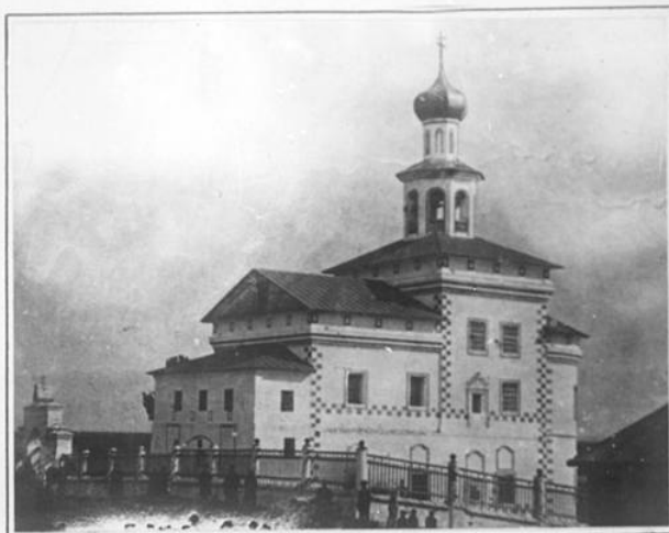
Одно из зданий монастыря, служившего местом организации контрреволюционных сил для борьбы с Красной Армией в 1918-1919 гг.

Церковь при Чердынском монастыре. Знамя для белогвардейского полка, вышитое шелком монахинями Чердынского монастыря (в центре двуглавый орел на фоне вязи и Андреевских крестов) – 1918-1919 гг.