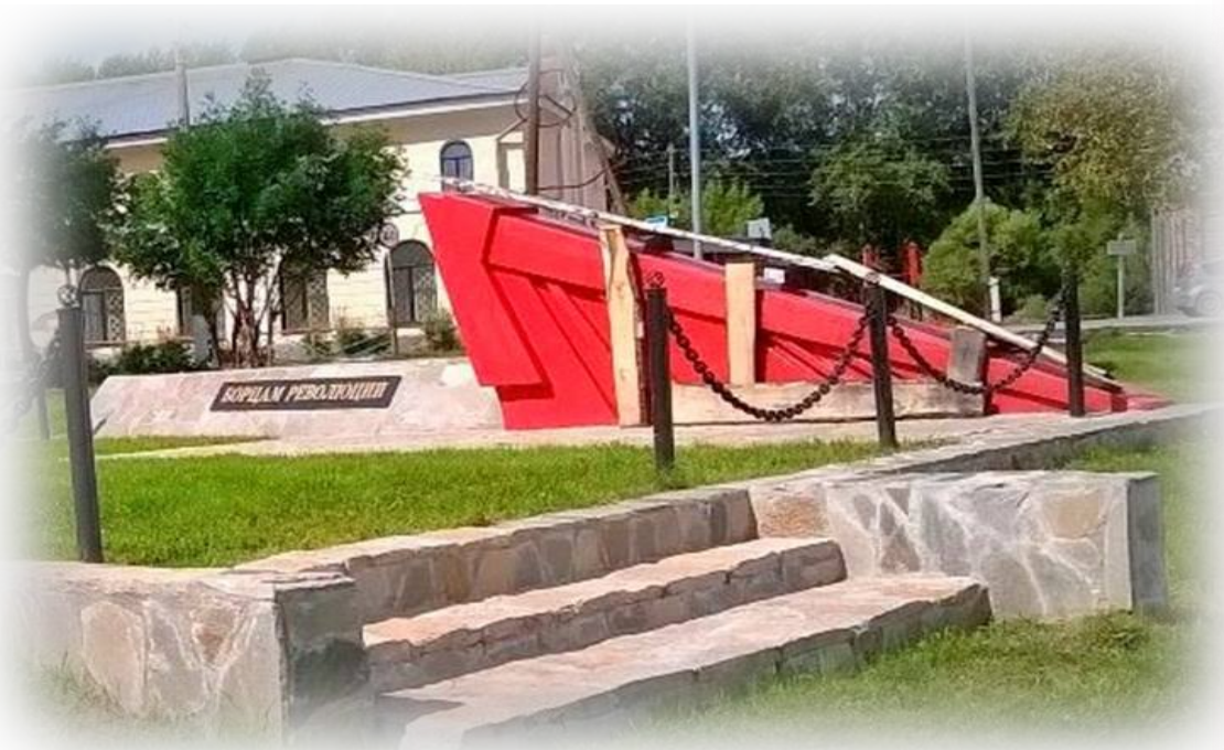
Братская могила советских и партийных работников г. Ирбита, расстрелянных колчаковцами. Фотография. 2017 год.