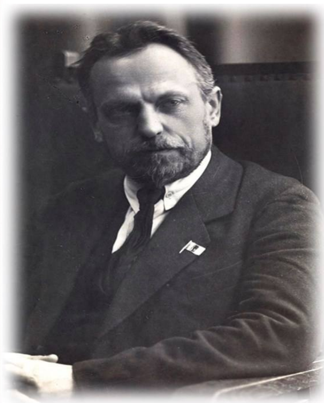
Николай Александрович Семашко — советский партийный и государственный деятель, врач, один из организаторов системы здравоохранения в СССР. Академик АМН СССР(1944г.)