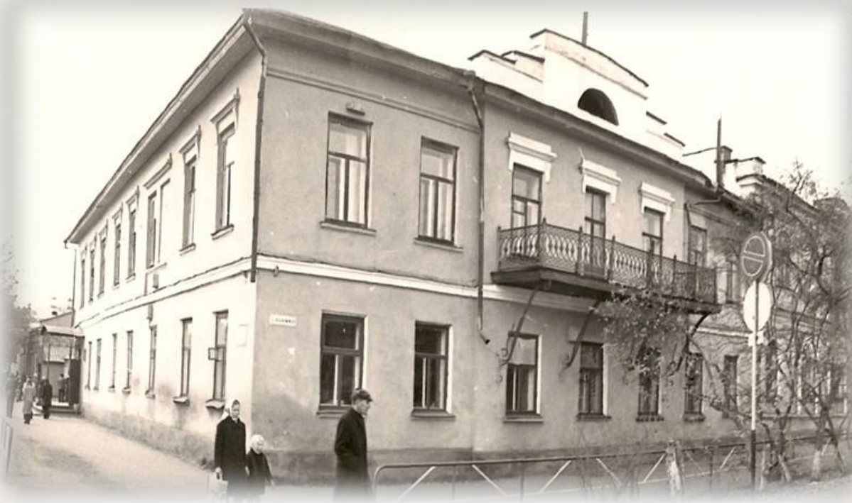
Здание бывшего Сибирского Банка. 1978 год. Фотография. Ул. Орджоникидзе, д.37. ГКУСО «ГА в г. Ирбите». К-1. Оп. 1ф. Д. 255.