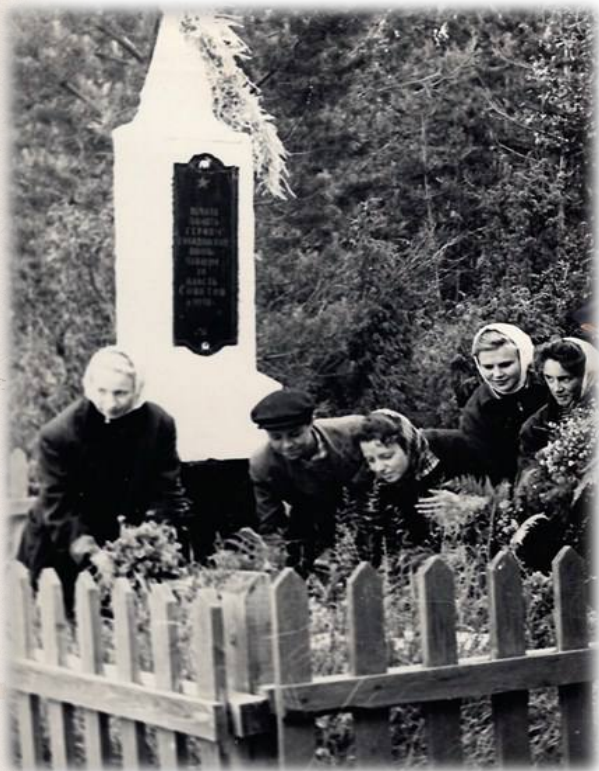
Памятник погибшим в годы гражданской войны с. Ключи. Фотография.