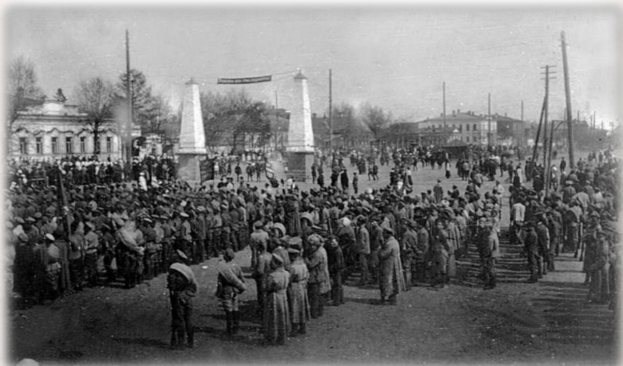
Парад частей Красной армии в Екатеринбурге. 1 мая 1920 г.