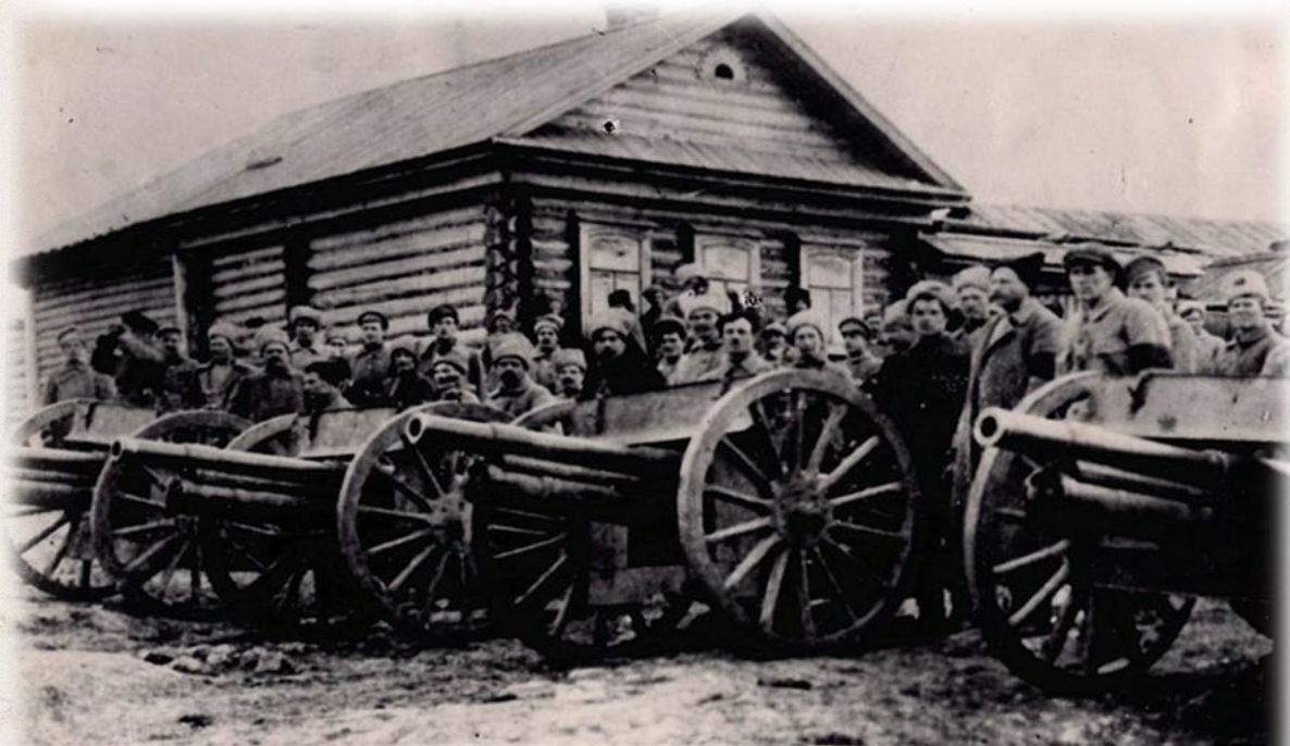
Артиллерия Камышловского полка. Фотография. 1918 г.