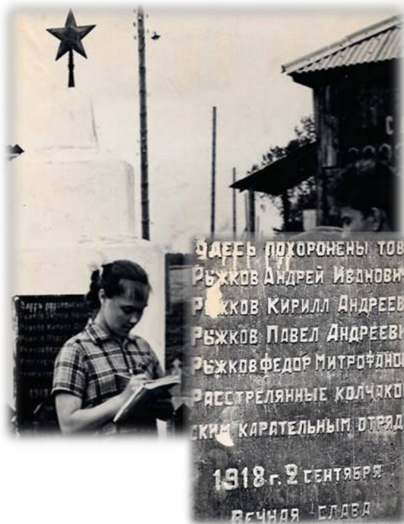
Памятник семье Рыжковых с. Ляпуново. Фотография.